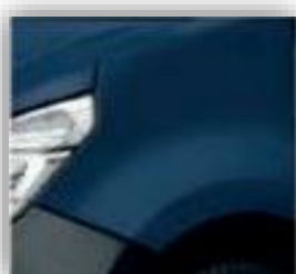
Volga kék- RNQ