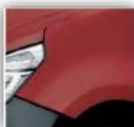
Piros - 719