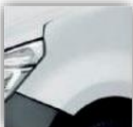
Fehér - QNG (felár nélkül)