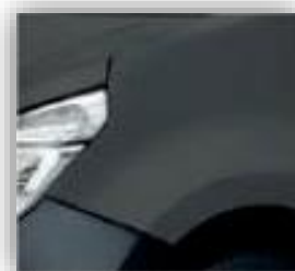
Szürke - KPW