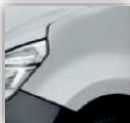
Homok szürke- KNH