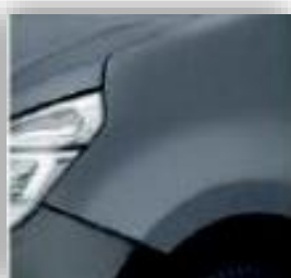
Kékes szürke- J47