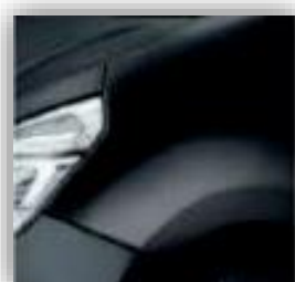
Fekete - 676

*- Az árak ÁFA nélkül értendők. A bruttó ár kiszámításához 27% ÁFA-t kell hozzáadni.